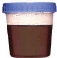
PARDAS Y TURBIAS NO ESTÁ OK