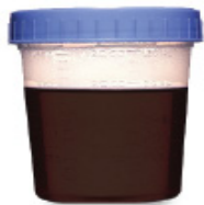
OSCURAS Y TURBIAS NO ESTÁ OK