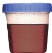
ANARANJADO OSCURO Y ALGO TRANSLÚCIDAS NO ESTÁ OK