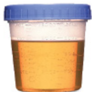
ANARANJADO CLARO Y CASI TOTALMENTE TRANSLÚCIDAS FALTA POCO