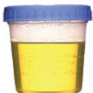
AMARILLAS Y TRANSLÚCIDAS, COMO ORINA ¡YA ESTÁ LISTO!

Cambios que se esperan en el color de las heces durante la preparación intestinal