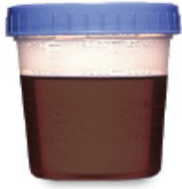
PARDAS Y TURBIAS NO ESTÁ OK