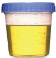
AMARILLAS Y TRANSLÚCIDAS, COMO ORINA ¡YA ESTÁ LISTO!

Cambios que se esperan en el color de las heces durante la preparación intestinal