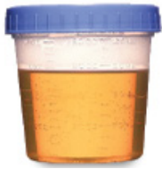
ANARANJADO CLARO Y CASI TOTALMENTE TRANSLÚCIDAS FALTA POCO